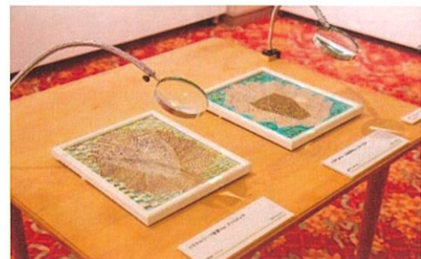
2021年度の作品展の様子