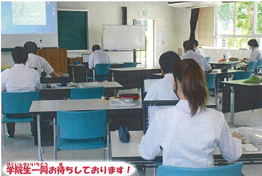
がくいんせいいっしょ 学院生一同お待ちしております！

うらめん ひつようじこう きにゅう ゆうそう もうしこみ 裏面に必要事項を記入し、FAXまたは郵送でお申込 ください