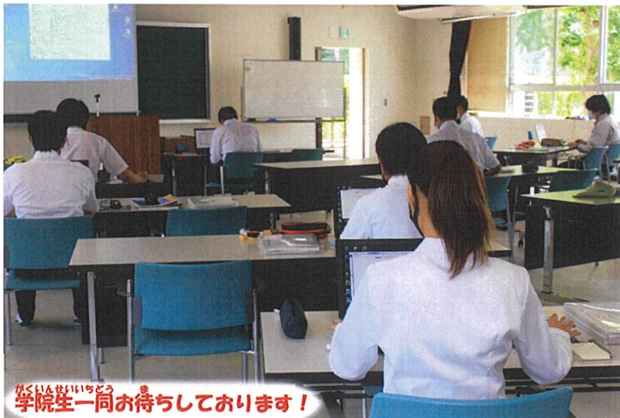
がくいんせいどう 学院生一同お待ちしております！

うらめん ひつようじこう きにゆう ゆうそう もうしこみ 裏面に必要事項を記入し、FAXまたは郵送でお申込 ください