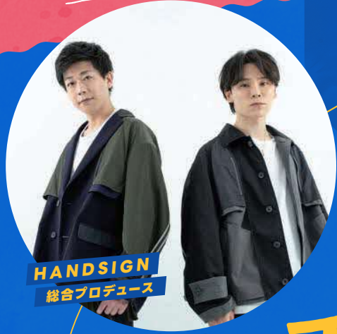
HANDSIGN 総合プロデュース