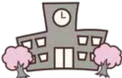
理解やサポート体制

(家庭だけでなく)様々な相談機関から情報を得ることで その子に合った接し方やサポートを見つけていきましょう