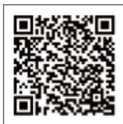
ひだまりサロン 高砂市健康増進課

保健師・助産師・歯科衛生士・管理栄養士が相談に応じ、ミニ健康教育もあります。 お友達が欲しい方などみんなで一緒にお話しましょう。